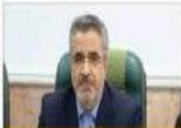
سرپرست اداره گل آموزش و پرورش مازندران

مدیر گل آموزشی مدارس مازندران خواستار تشدید زمانه های لازم برای افزایش گستره همکاری های مشترک بین مدیران گل