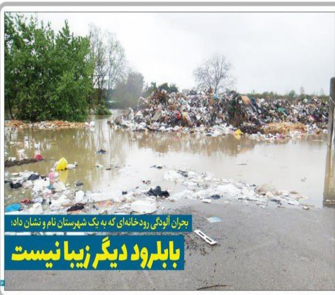
بحران آلودگی رودخانه های که به یک شهرستان نام و نشان داد، بابلرود دیگر زیبا نیست