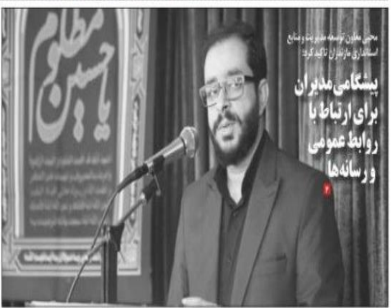
بولتن خبری مازندران

انتقال شهید نماینده شرق مازندران به خیر بستن برون‌بده پتروشیمی: هیچ مرجعی در دولت به تنهایی حق ابطال مصوبه را ندارد