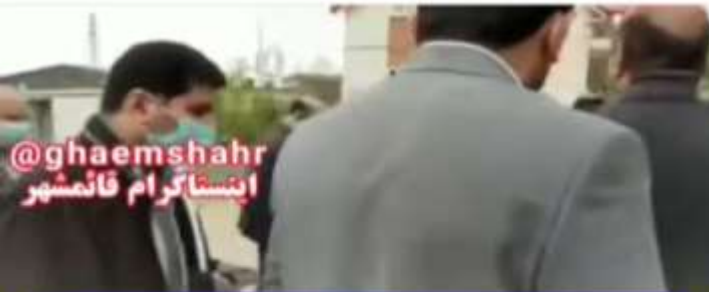
فایل صوتی دکتر مرادیان در چند ناینه آخر این کلیپ