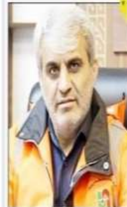
نواکوی سرپرست اداره کل راهسازی و حمل و نقل جاده ای استان مازندران