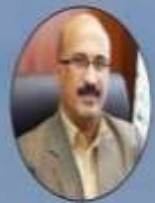
بروکسی مدیر کل محیط زیست مازندران خبر داد

مستور طی زاری گفت: پلیس امنیت مرزها در بخش شورای اسلامی نیریز بر این دیدار، گفت: فرماندهان انتظامی با حضور و عمل خود نشان داد که با تعیین تکلیف در سطح جامعه و در اجرای مأموریت های محوله به خوبی ایفای نقش می نمایند. فرماندهان پلیس در ایجاد امنیت مطلوب برای گزیندها و با تمام توان و حضور خود در عرصه های مختلف امور را تسهیل نمودند و امنیت در انتخابات مجلس شورای اسلامی، به همه هموطنان رساند.