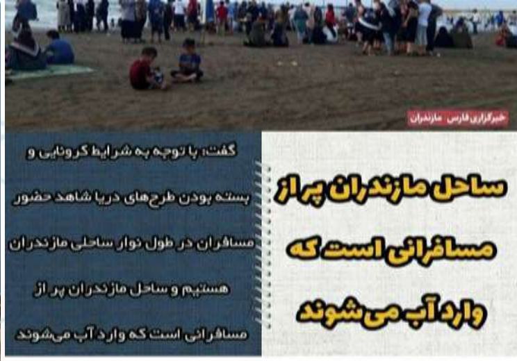
گشت، با توجه به شرایط کرونایی و بسته بودن طرح‌های دریا شاهد حضور مسافران در طول نوار ساحلی مازندران هستیم و ساحل مازندران پر از مسافرانی است که وارد آب می‌شوند ساحل مازندران پر از مسافرانی است که وارد آب می‌شوند