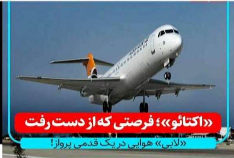
«اکتائو»؛ فرصتی که از دست رفت «لابی» هوایی در یک قدمی پرواز!