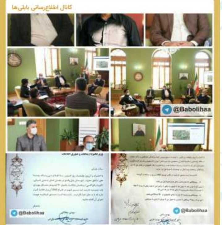
دیدار نمایندگان بابل و مدیر مخابرات مازندران با #وزیر ارتباطات

ری/ نفس کاسپین تنگ می‌شود مدیرکل هواشناسی مازندران: در