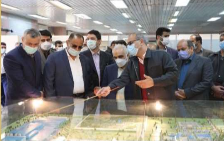
بازدید وزیر از شرکت صنایع چوب و کاغذ مازندران، بدون حضور استاندار و معاونانش؛