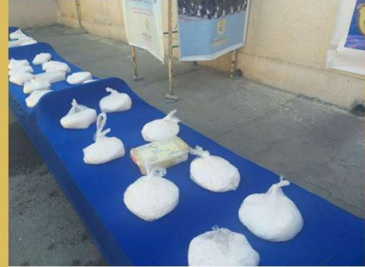
انهدام ۵ باند تهیه و توزیع مواد مخدر در مازندران

رئیس پلیس مبارزه با مواد مخدر مازندران : پنج باند تهیه و توزیع مواد مخدر در طرح پاکسازی نقاط آلوده و تشدید مقابله با خرده فروشان موادمخدر در استان منهدم شد طرح پاکسازی نقاط آلوده، تشدید مقابله با خرده فروشان و کنترل جاده‌های ارتباطی مازندران، ۲۴ ساعت گذشته اجرا شد که در این طرح، مأموران پلیس مبارزه با مواد مخدر موفق شدند ۵ باند تهیه و توزیع مواد مخدر را متلاشی و ۲۶۴ متهم را شناسایی و دستگیر کنند.