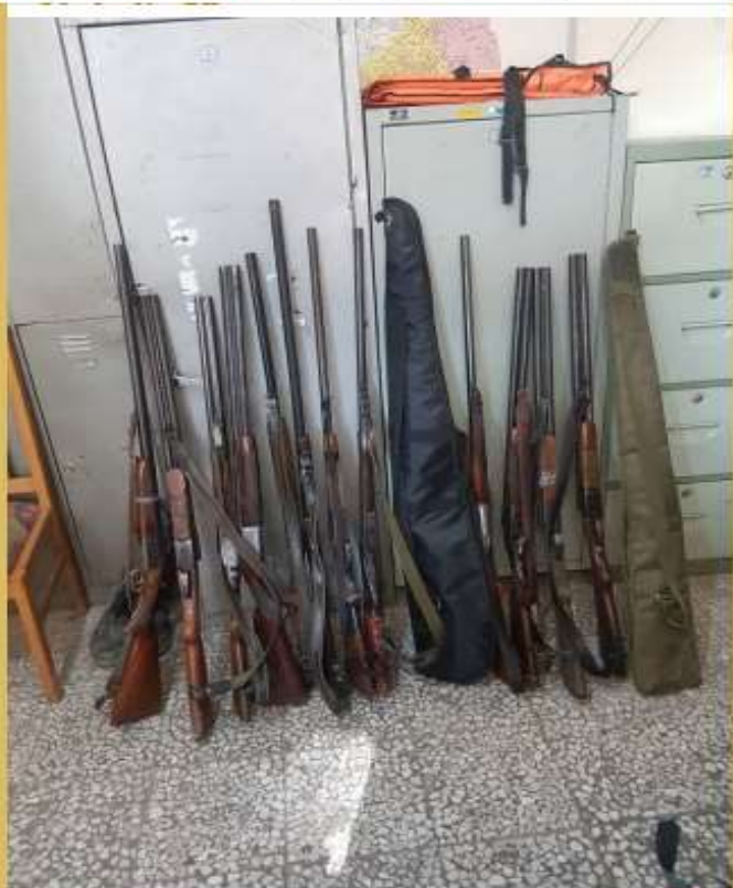
Photo. به منظور استقبال گسترده مردم در سال ۱۳