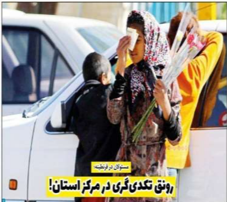
رونق تگدی‌گری در مرکز استان!

واکاوی مشکلات کارگران در گفت‌وگو با رئیس خانه کارگر مازندران؛