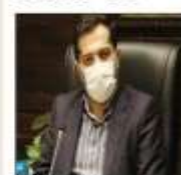
میزبان کلاس آموزشی