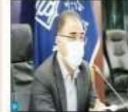
بیمارستان‌های دولتی مازندران