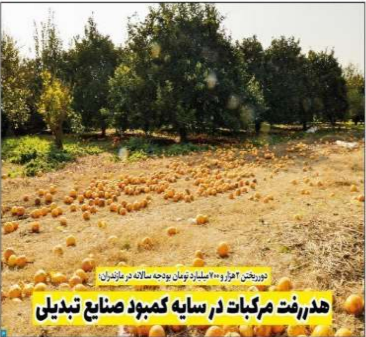
هدر رفت مرکبات در سایه کمبود صنایع تبدیلی