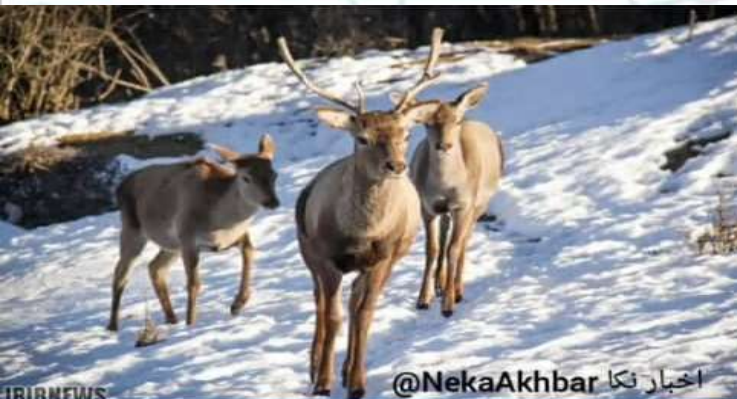
اخبار نکا @NekaAkhbar