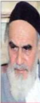
بیش از ۳۰ سال سابقه انتشار از هفته نامه تا روزنامه

روزنامه اکتال به خدا بکنید، اگر خدای نخواست این ایمان از دست ما گرفته بشود، این اکتال به خدا از دست ما گرفته شود، وحدت کلمه هم گرفته خواهد شد. باز خدای نخواست برگشتش به همان مصیبت‌هاست.