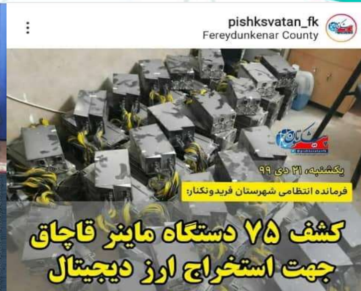
pishksvatan_fk Fereydunkenar County

هم‌اکنون ۵ شهرستان مازندران در وضعیت قرمز کرونایی هستند و این استان شرایط سخت پیک سوم کرونا را سپری می‌کند.