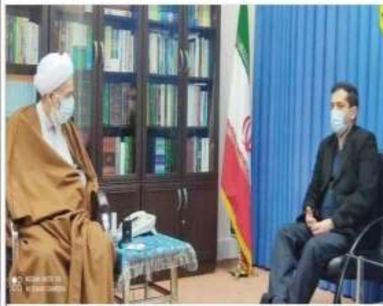
در دیدار سرپرست شهرداری ساری با نماینده ولی فقیه در مازندران تاکید شد:

با همت شهرداری و شورا اولین گرمخانه آمل راه اندازی شد