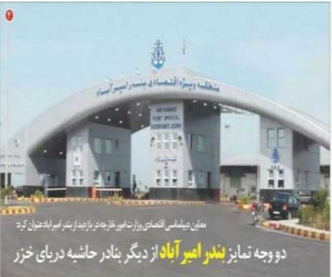
معین میبدالی رئیس سازمان صنعتی مازندران در دیدار با مدیران عامل واحدهای صنعتی استان دو وجه تمایز بندر امیر آباد از دیگر بنادر حاشیه دریای خزر

رئیس سازمان صنعتی مازندران نورالله میبدالی گفت: ۱۰ درصد کسب و کارهای کشور از مازندران تأمین می شود مدیرکل صمت مازندران گفت: ضرورت پر هیز شهرداری‌ها از کارهای سبسی