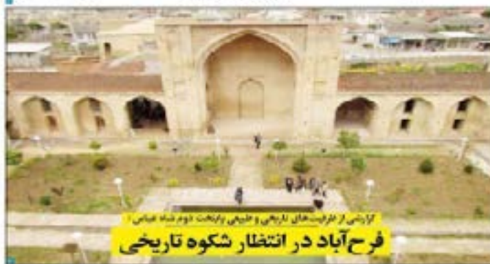
گزارشی از فریبتهای تاریخی و طبیعی پارک تفریح دوم شاه عباس ۱ فرح آباد در انتظار شکوه تاریخی

چگونه تپسی از جهنم بدست مردم بقایند شد؟ ۱۳۹۷ - ۲۲ خرداد ۱۳۹۷ - تهران ۲۲۹۷ - شماره ۲۲۹۷ - تهران ۲۲۹۷ - تهران ۲۲۹۷ توسعه گردشگری استان گلستان ۱۳۹۷ - ۲۲ خرداد ۱۳۹۷ - تهران ۲۲۹۷ - شماره ۲۲۹۷ - تهران ۲۲۹۷ - تهران ۲۲۹۷ سازمان اسناد و کتابخانه ملی ۱۳۹۷ - ۲۲ خرداد ۱۳۹۷ - تهران ۲۲۹۷ - شماره ۲۲۹۷ - تهران ۲۲۹۷ - تهران ۲۲۹۷ استاندارد های ملی ۱۳۹۷ - ۲۲ خرداد ۱۳۹۷ - تهران ۲۲۹۷ - شماره ۲۲۹۷ - تهران ۲۲۹۷ - تهران ۲۲۹۷