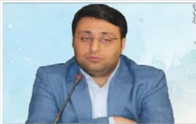
گزارش «دلیپر شمال» از نشست خبری مدیر صندوق بیمه اجتماعی کشاورزان، روستاییان و عشایر مازندران