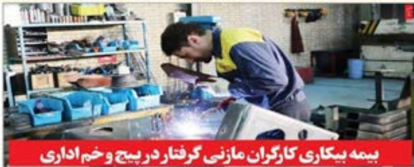
بیمه بیکاری کارگران مازنی گرفتار در پیچ و خم اداری

مدیرکل برق مازندران: صنعت مازندران شهرک صنعتی بزرگ در شرق استان مازندران احداث می‌شود