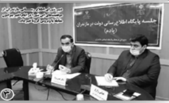
جلسه با نگاه اطلاع رسانی دولت در مازندران (یادآوری)