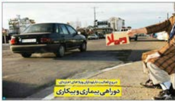
دوره‌های بیماری و بیکاری