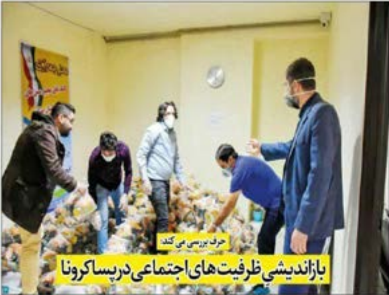
حرف بررسی می‌کند

بازاندیشی ظرفیت‌های اجتماعی در پسا کرونا