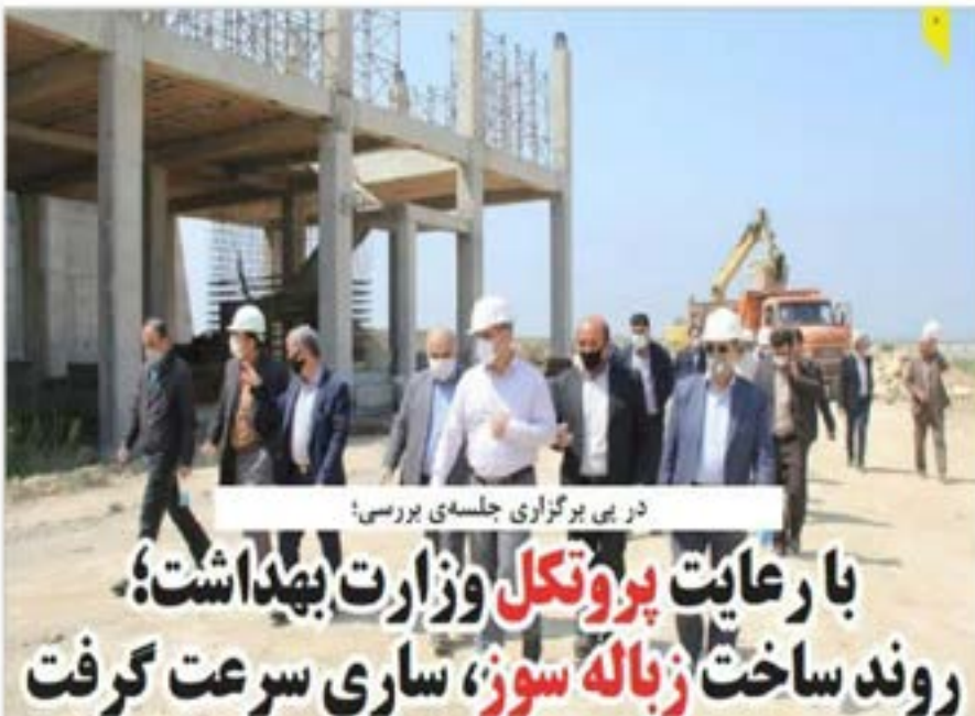
در پی برگزاری جلسه ی بررسی:

با رعایت پروتکل وزارت بهداشت؛ روند ساخت زباله سوز، سازی سرعت گرفت