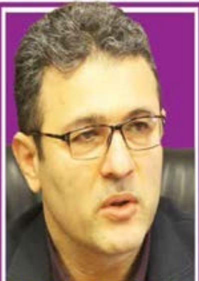
مدیرعامل شرکت توزیع نیروی برق غرب مازندران ۱

ارایه برق پایدار دغدغه اصلی شرکت توزیع نیروی برق غرب مازندران