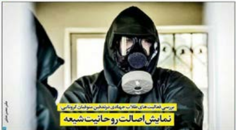
بررسی فعالیت های حلاب جهادی در تلمش سولیمان کروناس نمایش اصالت روحانیت شیعه

استاد محترم دکتر سید علی حسینی امری برتانه های ماه رمضان با توجه به شرایط کرونایی