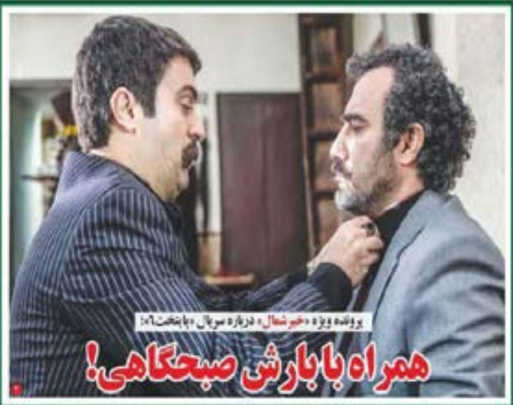
پرونده ویژه «خبر شمال» درباره سرپال «بابتخت» همراه با بارش صبحگاهی!