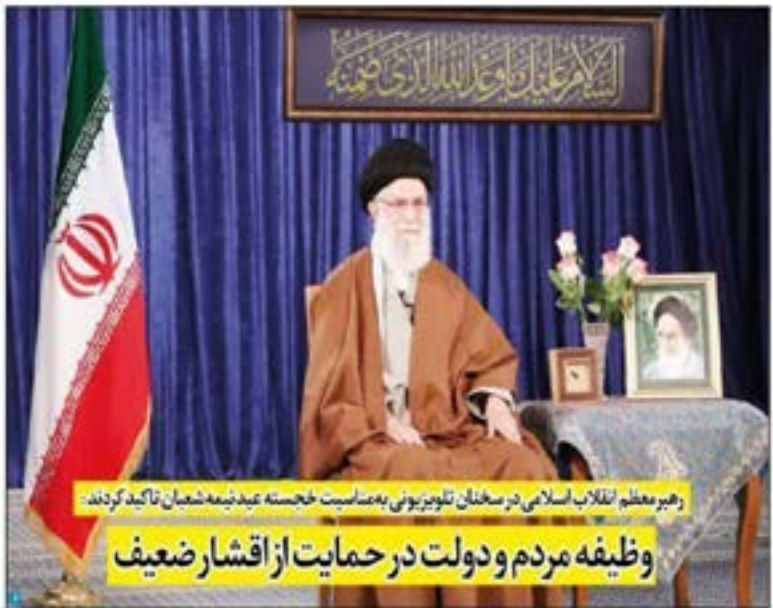
رهبر معظم انقلاب اسلامی در سخنان تلویزیونی به مناسبت نخستین عید نیمه شعبان تاکید کردند: وظیفه مردم و دولت در حمایت از اقشار ضعیف

شهریار جلیس اعلام کرد: ادامه نهضت ضدعولنی معاصر شهری و مناطق پرتردد