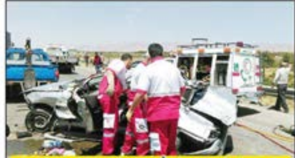
حوادث جاده‌ای، نیمی از مأموریت های هلال احمر مازندران