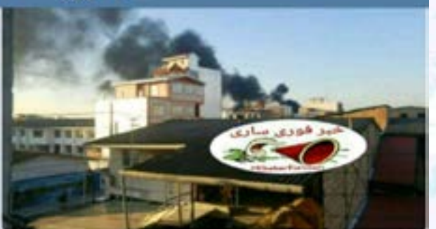
دلیل دود سیاه در ساری

روزانه حدود ۶ هزار لاشه پرنده از تالاب فریدونکنار و با برخی شهرهای دیگر برای در بازاری غیرقانونی عرضه می شود که با احتساب قیمت هر لاشه یک میلیون ریال، روزانه حدود سه تا ۶ میلیارد ریال درآمد نصیب مافیای شکار می شود.