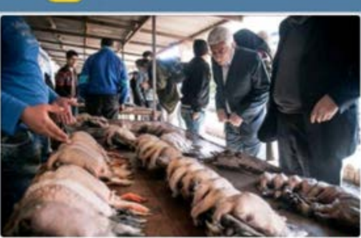
درباره مافیای شکار بیشتر بدانیم

شیوع مرحله دوم و سوم شاید به شدت مرحله اول نباشد، اما به دلیل شدت وقوع مرحله اول این بیماری نسبت به مدت مشابه پارسال، هنوز نمی توان نسبت به نوسان آن اطلاع رسانی کرد، ولی خطر همچنان وجود دارد