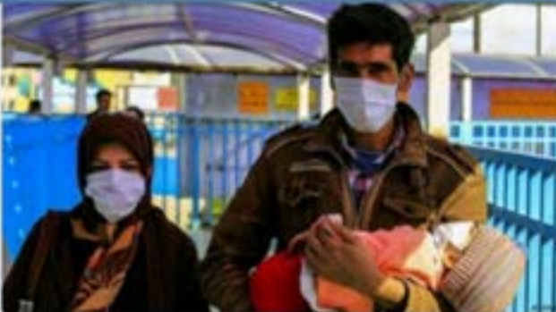
ادامه تهدید آنفلوانزا در مازندران

معاون بهداشتی دانشگاه علوم پزشکی مازندران: مرحله اول شیوع آنفلوانزا در استان همانند سایر نقاط کشور فروکش کرد اما این به معنای رفع خطر وقوع این بیماری نیست.