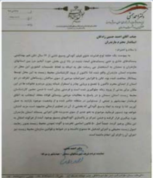
تذکره نماینده معلمان به استاندار مازندران در خصوص بحران زیاده و پسماند