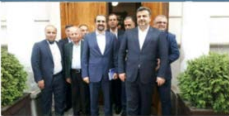
استاندار مازندران در نشست با سفیر ایران در روسیه مطرح کرد:

ضرورت راه اندازی پایانه بین المللی صادرات محصولات کشاورزی مازندران در روسیه