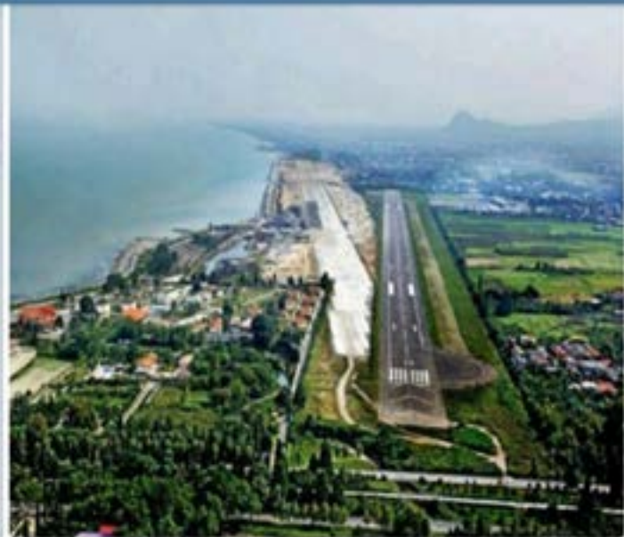
نصب #سامانه_کمک_ناوبری_هوایی بزودی در «فرودگاه های مازندران»

▼ فارغ از ضرورت پیگیری جدی حل معضل گویچاله، پاسخ قاطع استاندار مازندران به نماینده زیاده خواه سمنان و تذکر جایگاه حقوقی و حدود اختیارات ایشان و همچنین یادآوری ده ها مورد از مغایرت های اجرای طرح شیرین سازی و انتقال کاسپین با اصل ۵۰ قانون اساسی، کمترین اقدام مورد انتظار مردم مازندران از حسین زادگان است