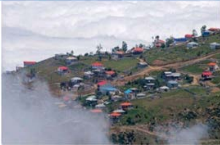
▲ فروش زمین به اتباع بیگانه ممنوع

مدیر امور اتباع و مهاجرین خارجی استانداری مازندران: