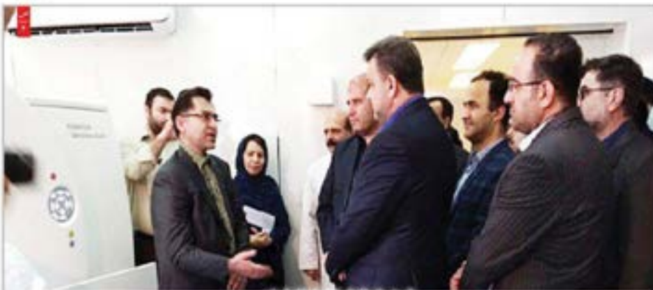
ماحضرو استاندار مازندران انجام شد